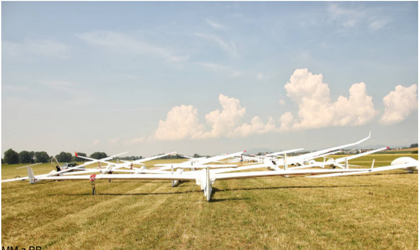
MM z BB